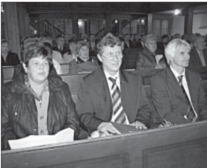
Landtagsabgeordnete Gudrun Holbe, Minister Klaus Zeh und Bundestagsabgeordneter Johannes Selle während der Festandacht zum Tag der Deutschen Einheit in Wiehe.