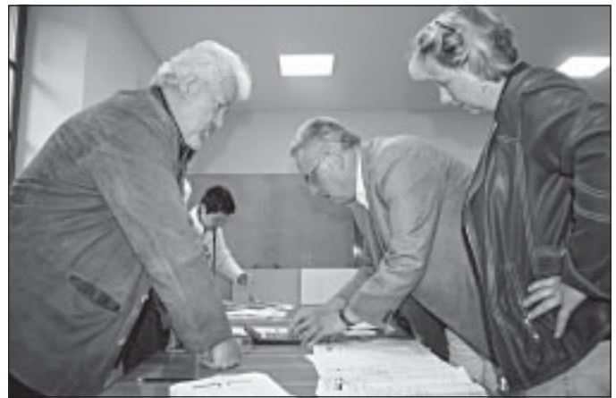
Die Wahlen im Superwahljahr 2009 haben wir Dank der Unterstützung vieler ehrenamtlicher Helfer ordnungsgemäß vollziehen können. Auf unserem Foto sind die Wahlhelfer in Langenroda als ein Beispiel für alle anderen Wahlvorstände der Stadt bei der Auszählung der Stimmen zu sehen.